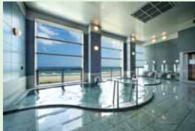
展望風呂からは太平洋の大パノラマが