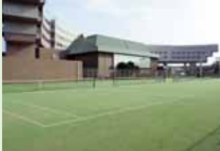
全天候型テニスコート 5面