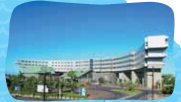
サンライズ九十九里