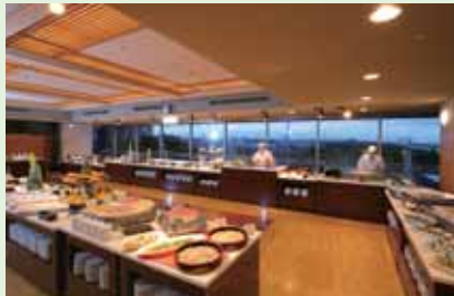
房総の旬の料理と九十九里名物料理全50種類!!