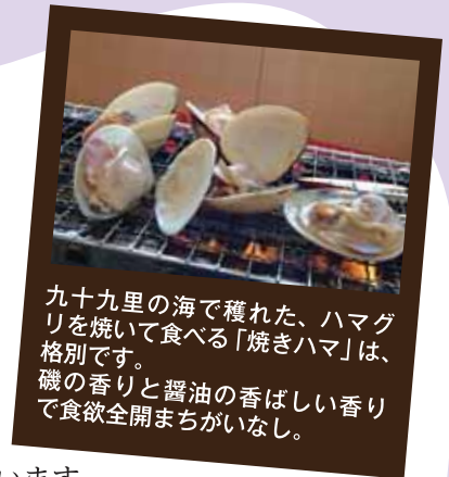
九十九里の海で穫れた、ハマグリを焼いて食べる「焼きハマ」は、格別です。磯の香りと醤油の香ばしい香りで食欲全開まちがいなし。

もちろんクラムチャウダーやシチューなどの洋食にも合います。九十九里海岸沿いには焼きはまぐりが味わえる飲食店が並び、これを目当てに観光客が訪れます。