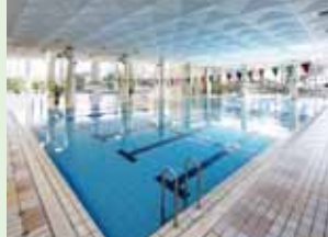
スイミングや水中歩行で健康増進!