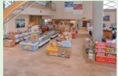
九十九里や千葉の特産が充実!!